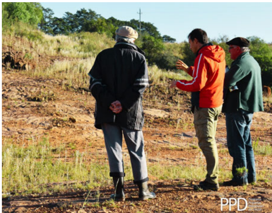
Los técnicos y productores fueron diseñando las pautas para restaurar los campos naturales degradados. «Aprendamos junto con el productor», destaca un técnico del INIA.

Texto: Programa de Pequeñas Donaciones. ppduruguay.undp.org.uy