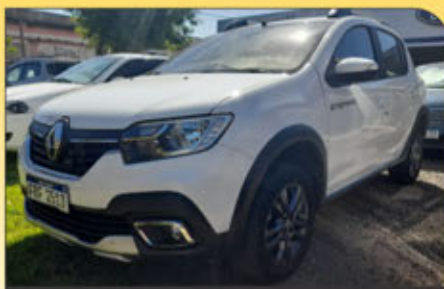
RENAULT Stepway año 2020 on 41.700 km