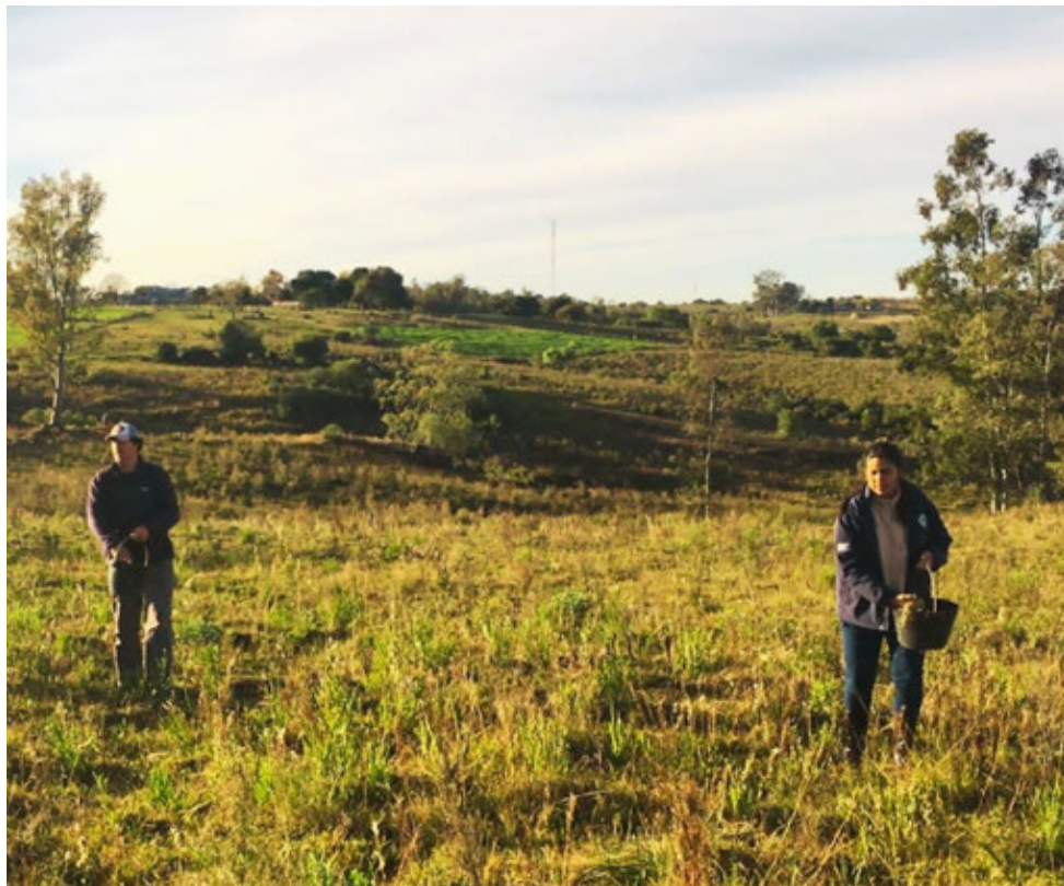
Productores de la Sexta Sección sembrando semillas para recuperar el campo natural.

A partir de una encuesta que realizaron en 2019 entre los socios de la SFRSS pudieron saber que la enorme mayoría de los productores ganaderos que la integran tenían una carga elevada para estos campos. Se identificaron potreros o sectores de potreros con erosión de suelos, alto porcentaje de suelo desnudo, baja frecuencia de especies forrajeras valiosas e invasiones de especies exóticas. Esta degradación del campo natural en dichos predios era consecuencia del sobrepastoreo, en algunos casos combinado con agricultura extensiva (maíz y avena, principalmente), sin hacer el verdeo posterior, lo que facilita la colonización del suelo por la gramilla. Además, en muchas de esas chacras se perdían las especies forrajeras buenas y la calidad del campo natural.