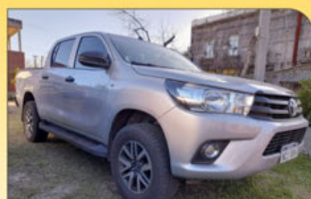
TOYOTA Hilux 2.5 diésel año 2017