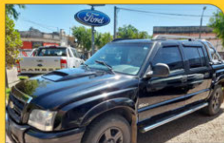
CHEVROLET S10 diésel 2.8 MWM 2011