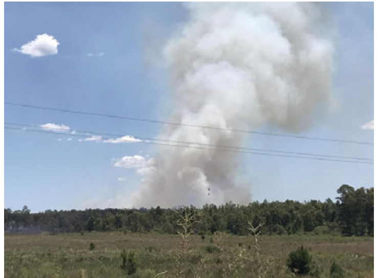
Ayer a la tarde se originó un incendio en un área forestada próximo al barrio Godoy.