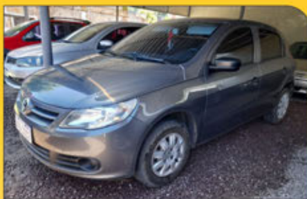
Volkswagen Gol año 2011