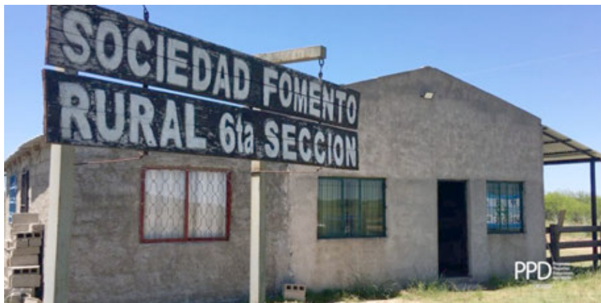
En 2021 la Sociedad de Fomento Rural 6ta. Sección elaboró una propuesta para recuperar campos naturales, recibiendo el apoyo del Programa de Pequeñas Donaciones y del INIA.

PPD Uruguay, señaló que «el primer resultado es la reacción que tiene el campo a la primera medida que es cerrarlo, es imponente, la cantidad de especies que han surgido que por el sobrepastoreo no aparecía, y el segundo gran resultado es que pudimos instalar el bromus . Si le cuidamos el pastoreo, el año que viene va a florecer y va a sembrar y ahí va a expresar realmente el potencial de él, con una especie que es perenne, que es nativa del campo. Va a permanecer en el campo muchos años con un buen manejo, sin necesidad de volver a sembrar».