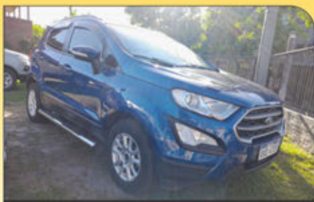
FORD Ecosport 1.5 año 2019